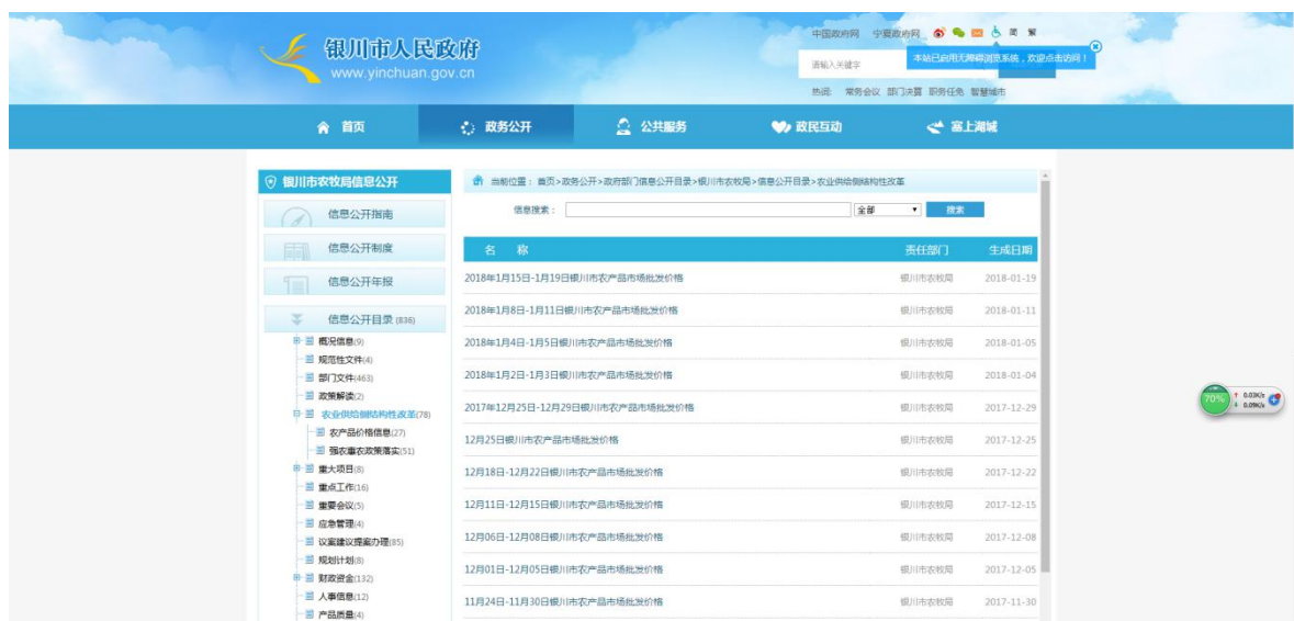
银川市农牧局在银川市政府信息公开网站公开农业供给侧结构性改革

三是公开农村土地承包经营权确权登记颁证等工作进展情况。银川市农牧局进一步加大农村土地承包经营权确权登记颁证的业务指导和工作督导力度，确保农村土地确权登记颁证工作高标准高质量完成，公开了全市各县（市）区确权登记颁证工作进展情况的通报。