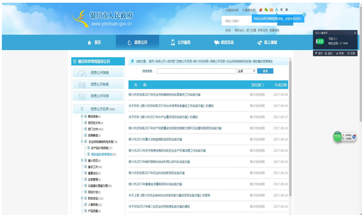
银川市农牧局在银川市政府信息公开网站公开强农惠农政策

一是加大强农惠农政策公开力度。围绕贯彻落实中央一号文件和农业部一号文件精神，在银川农业网和银川市农牧局政府信息公开栏目及时公开了2017年农作物病虫害防治、支持粮食生产、促进农民增收政策措施、农业生产安全、农业扶持政策等内容51件。