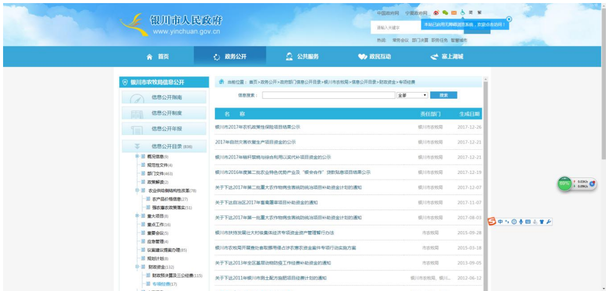
银川市农牧局在银川市政府信息公开网站公开财政资金和专项经费使用情况