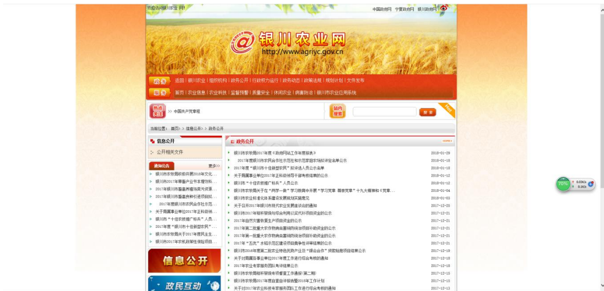
银川市农牧局在银川市农业网公开重点领域信息