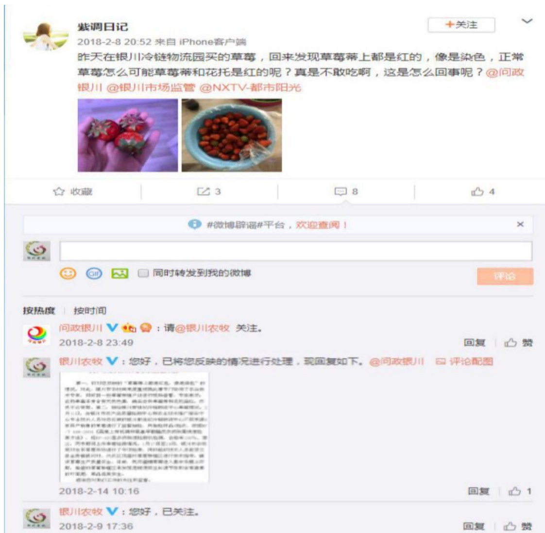
运用政务微博回应群众关切