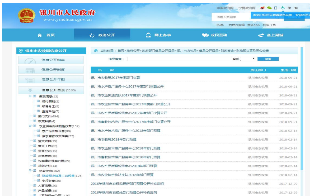
银川市农业农村局在银川市政府门户网站公开财政资金和专项经费使用情况