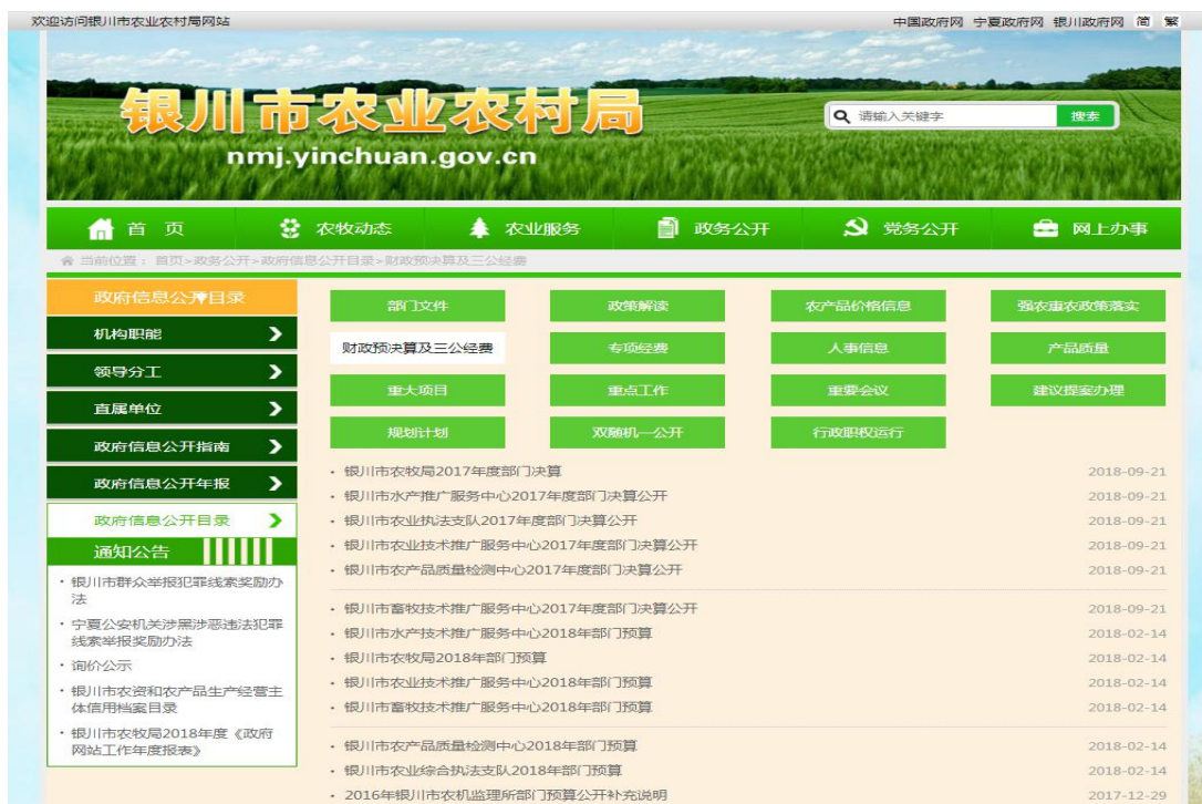
银川市农业农村局在银川市农业网公开重点领域信息